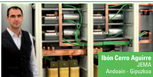
Ibón Cerro Aguirre JEMA Andoain - Gipuzkoa

Mi trabajo como Gestor Técnico de proyectos en el departamento de I+D consiste en compaginar las tareas de gestión global del proyecto con las acciones de desarrollo del software de control (DSP y FPGA) para sistemas de electrónica de potencia . Estos sistemas están orientados a aplicaciones industriales que demandan una solución a medida.