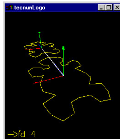
Figura 2 Posición inicial y trasladada