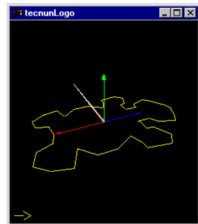
Figura 3 Giro a la derecha